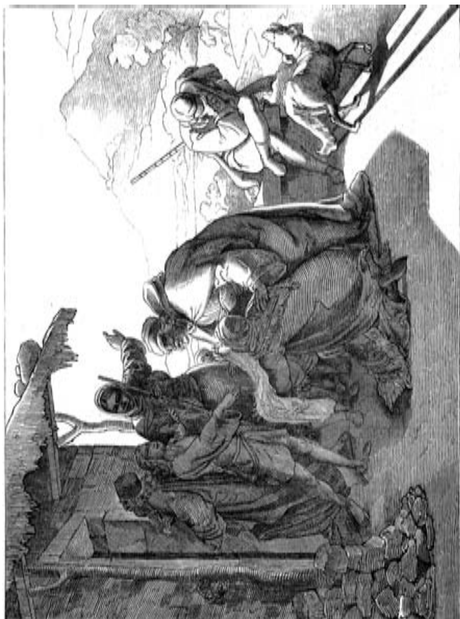
Ein Mann der Wüststraße bei den Wüstlingen.