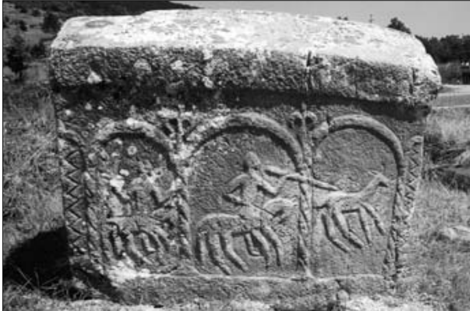
Stećak Vladne Kustražić. Cista Velika.

Kristijaniziranje Vlaha bilo je površno. 626 Ovo je razlog da u pojedinim dijelovima nekadašnje Bosne i Hercegovine ima manje stećaka vezanih uz katoličke crkve. U kraškom području zemlje Pavlovića stećci su smješteni na dalekim visoravnima kao i u njihovim poljima i šumi. “Neizbežno i skoro redovno vezani su za praistorijske kamene tumule, ponekad uz gradine ili glavice, ali i uz antičke ruševine ili ostatke nekadašnjih sednjovekovnih crkava, ... Ali najčešće, nebrojeno puta leže uz pravoslavna groblja i crkvice i sasvim izuzetno uz katolička groblja sa odgovarajućim crkvicama, što naročito važi za groblja u Konavlima (Plat, Cavtat, Brotnjice).” 627