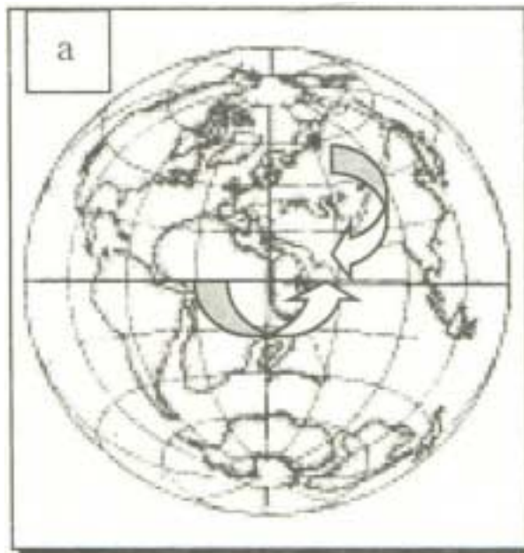
a) Položaj kontinenata rekonstruisanim na osnovu prastarog zemljinog magnetizma. Evroazija je rotirala u smeru kretanja kazaljke na satu, a Afrika u suprotnom smeru.