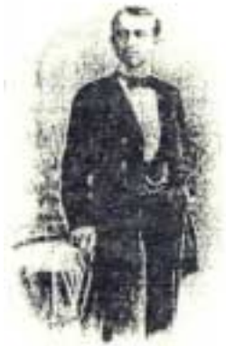
Milutin Milanković iz vremena kada je studirao u Beču

Milutin Milanković se rodio u Dalju-Baranja 1879. godine u imućnoj porodici čiji su izdanci imali visoko obrazovanje, među njima je i njegov deda Uroš Milanković, značajni filozof. Milutin je završio srednju školu u Osijeku kao đak generacije. Potom prelazi u Beč gde je završio studije građevinske tehnike 1902. godine, a samo dve godine kasnije je i doktorirao.