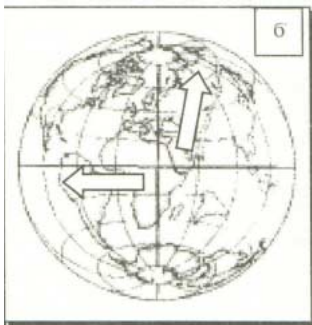
b) Istovremeno odvijalo se i kretanje Južne Amerike ka zapadu i Afrike i Azije ka sevroistoku.

Na ove podatke savremeni čovek neće ragovati. Sudbina pola rotacije samo naizgled neće uticati na čoveka. Putanja polova rotacije neće biti matematički idealna kako je Milanković prikazao. Svaki kontinent ili čak svako ostrvo imaće svoju specifičnu